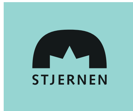
... mens det her træder tydeligt frem

Brugen af den farvede udgave af logoet bør begrænses til enten en hvid baggrund eller en baggrund bestående af en 15 % tone af bogstavernes farve.